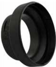
Adapter / reduktionsstykke