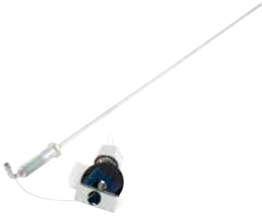
Tankudtag Kan skæres til i længden.