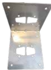
Monteringsbeslag til Airtronic D2 / D4