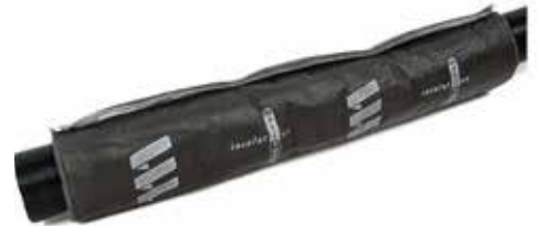
Isoleringsmätte wrap L: 750 mm

Maxitherm isolering til varmluftslange. Fastgøres med trykknåplåse